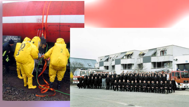
Feuerwehrarbeit zu leisten ist eine wertvolle und wichtige Erfahrung.

Den Feuerwehrdienstleistenden wird Einiges abverlangt, aber auch viel geboten: Kameradschaft, Teamarbeit, Möglichkeiten zur Weiterbildung, Erlangen von Kenntnissen, die auch im Alltag von Vorteil sein können und last but not least: Freude am Helfen in der Not.